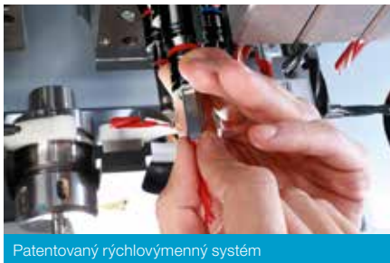
Patentovaný rýchlovýmenný systém

Časové ohraničenie akcie 01.09.2023 – 31.12.2023