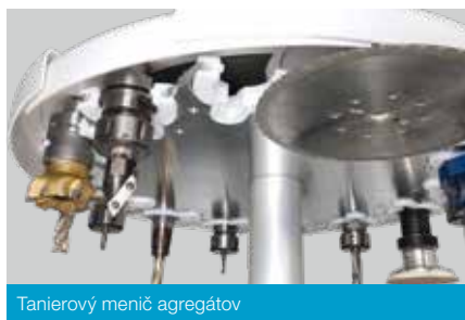
Tanierový menič agregátov