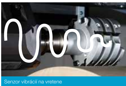
Senzor vibrácií na vretene