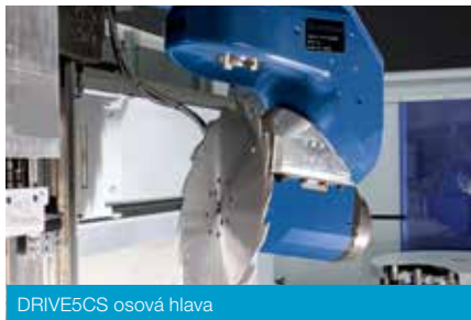
DRIVE5CS osová hlava